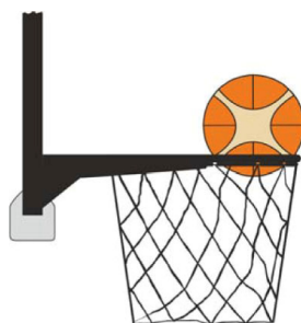
Dijagram 3. Lopta je unutar koša

31-20 Iskaz. Prekršaj ometanja nastaje ako igrač odbrane dodirne loptu dok je ona unutar koša.