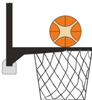
Dijagram 2. Lopta dodiruje obruč

31-15 Iskaz. U toku šuta na koš iz igre, igrač odbrane ili napada je načinio ometanje kada dodirne koš ili tablu dok je lopta u dodiru sa obručem i još ima mogućnost da uđe u koš.