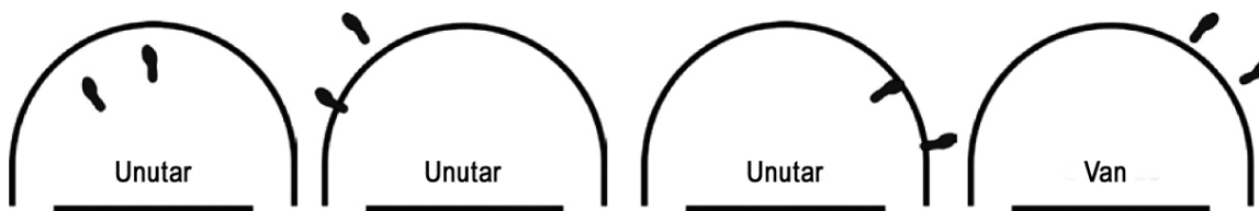
Dijagram 4. Položaj igrača unutar/van polja polukruga bez probijanja

Tumačenje: Pravilna igra igrača A1. Primenjuje se pravilo o polukrugu bez probijanja.